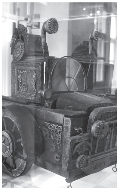
Шкафчик с секретом.

экспонат выставки - костюм палача. В карманах одежды - множество медицинских инструментов. Они, по мнению художника, придают образу более жуткий вид. На