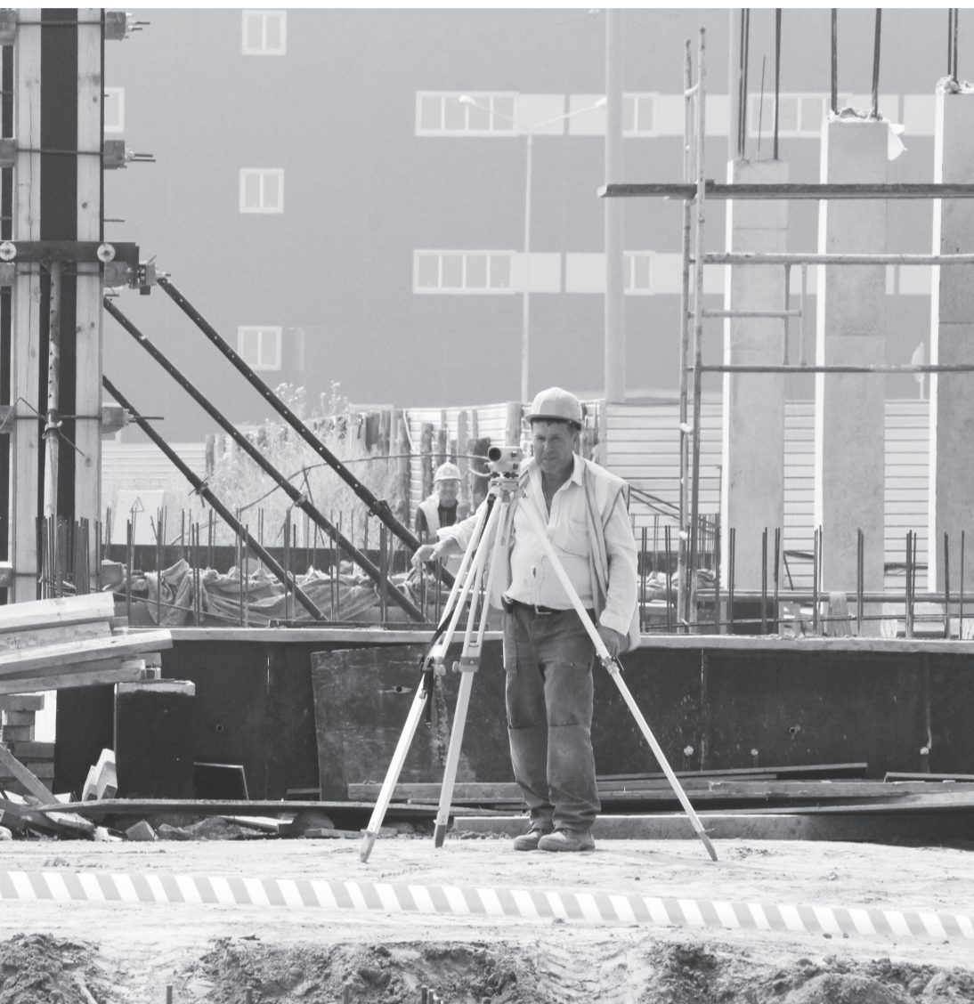
ПОЭЗ «Ульяновск». Строительство таможенного комплекса только началось.

момента постановки имущества, транспортно-го средства или земельной собственности на учет; отсутствие таможенных пошлин и НДС на иностранные товары, ввозимые на территорию ПОЭЗ. Кроме того, земельные участки в собственность предоставляются по минимальным ценам, а вся бюрократическая документация ведется в режиме «одного окна».